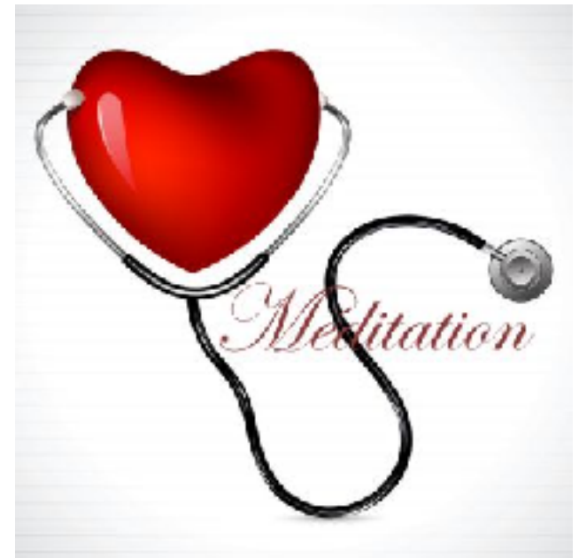
Par Lionel Sansoucy